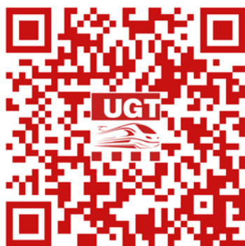
Cursos Grupo RENFE